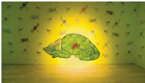
“Το όνειρο του χαμαιλέοντα”, του καλλιτέχνη “No More Lies”, 2014, στένσιλ και σπρέι, Μουσείο Πέρα, Κωνσταντινούπολη.

Προκειμένου να πάρει εκδίκηση για μια ανύπαρκτη αδικία δεν σταματά μπροστά σε τίποτα. Θεωρεί ότι η εκδίκηση δεν είναι τίποτε άλλο από απόδοση δικαιοσύνης. Βαθιά μέσα τον κατέχει η κακία. [7] Τα όρια, οι δισταγμοί και οι τύψεις, του είναι άγνωστα. Όταν δυσκολέψουν οι καταστάσεις επιστρέφει πάντα στο σκοτάδι