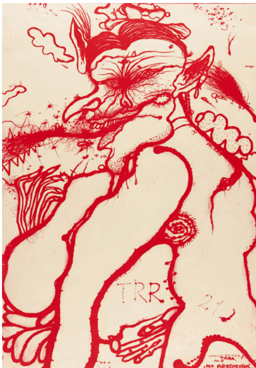
Άρνούλφ Ράινερ, "Ο μυγοχάφτης", 1966, λιθογραφία. MoMA, Νέα Υόρκη.

Η επόμενη επίσκεψις ονομάτων έχει να κάνει με τις λέξεις «πολύποδες» και «πολιτισμός». Είπαμε ότι οι πολύποδες δίνουν στον πολιτισμό το πρόσωπό τους, απωθούν ή απομονώνουν τους αντιπάλους και δρέπουν τους καρπούς της επικυριαρχίας τους. Οι πολύποδες παραπέμπουν σε πραγματικούς ανθρώπους που ασκούν επιρροή και ακολουθούν πολιτικές. Επί της ουσίας είναι οι