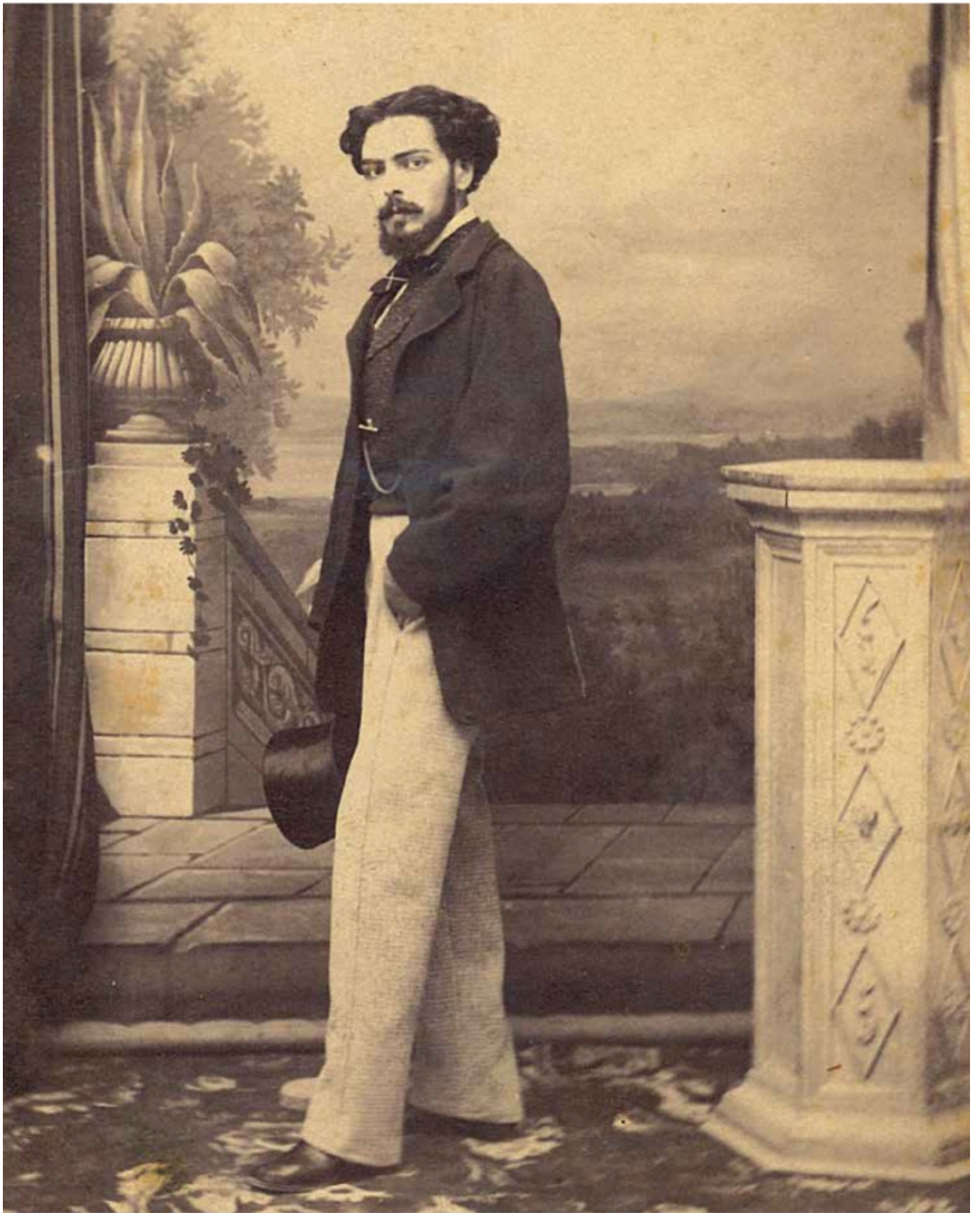
Ο Εμμανουήλ Ροΐδης (1836-1904).