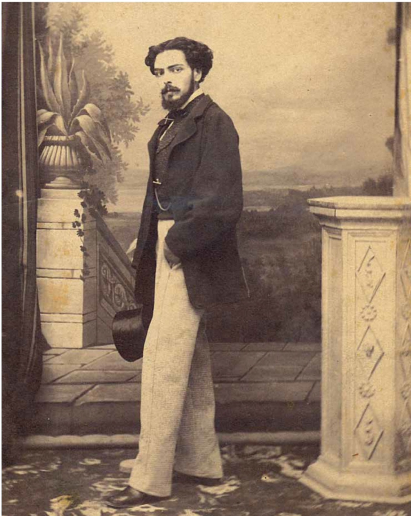
Ο Εμμανουήλ Ροΐδης (1836-1904).